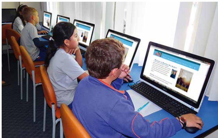
Estudiantes 6to. de Básica "A" en clases de indagación.

"Las actividades realizadas en el research room nos permiten fomentar la curiosidad por aprender y ayudan a estimular el pensamiento crítico.