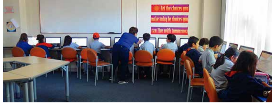
Estudiantes 4to. de Básica "B" en clases de indagación.